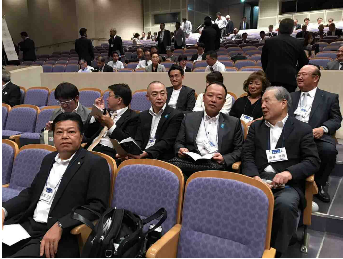
受付・登録後 第3グループの場所に着席