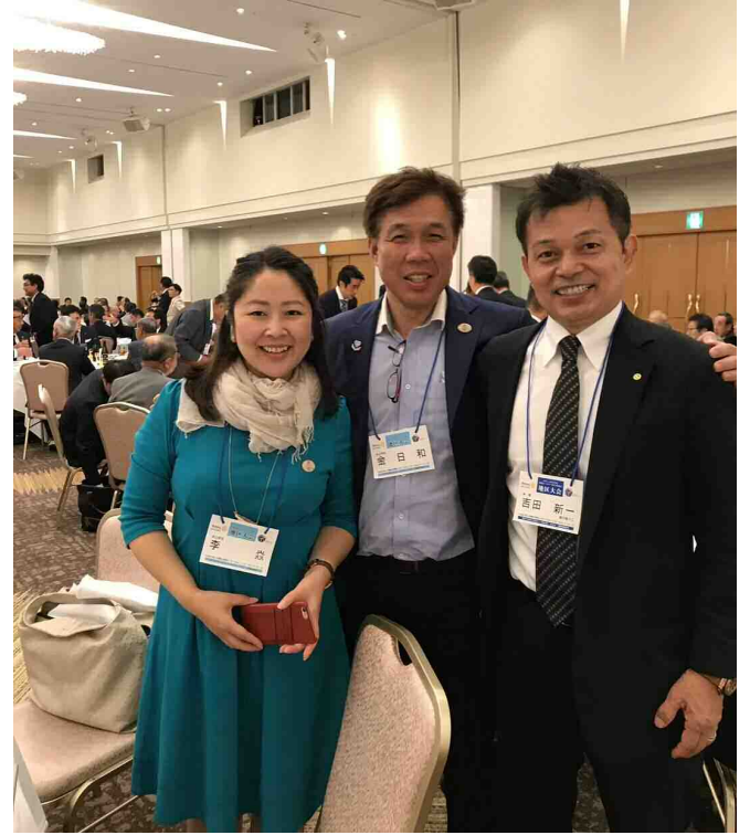
「お二人とも、是非、藤沢東RCへ卓話に来て下さい。」