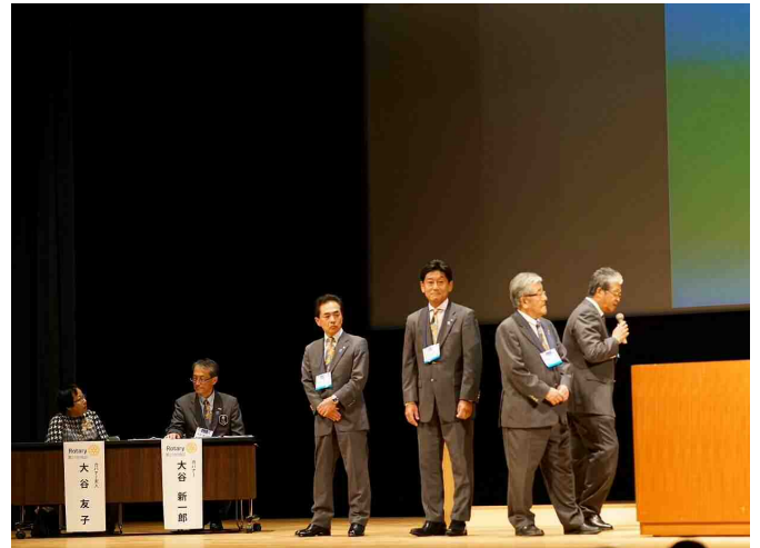
藤沢東ロータリークラブ紹介