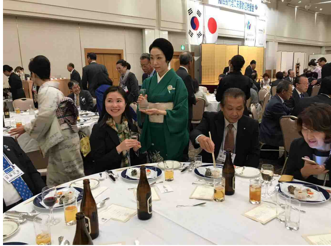
京都祇園の芸子さんの「歓迎の舞」