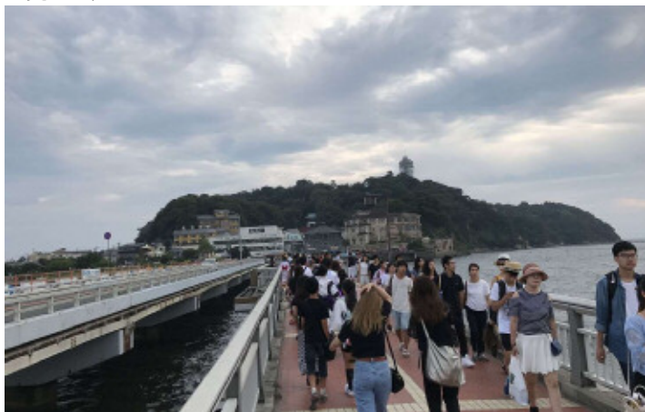
アイランドスパから見た打上場所。