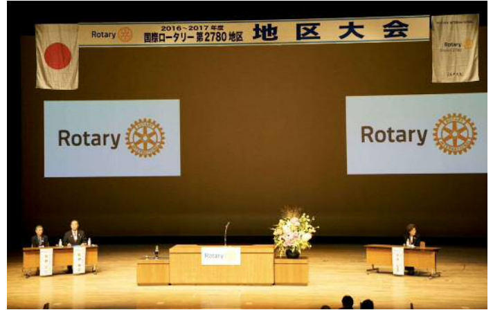
佐野英之 2780 ガバナー