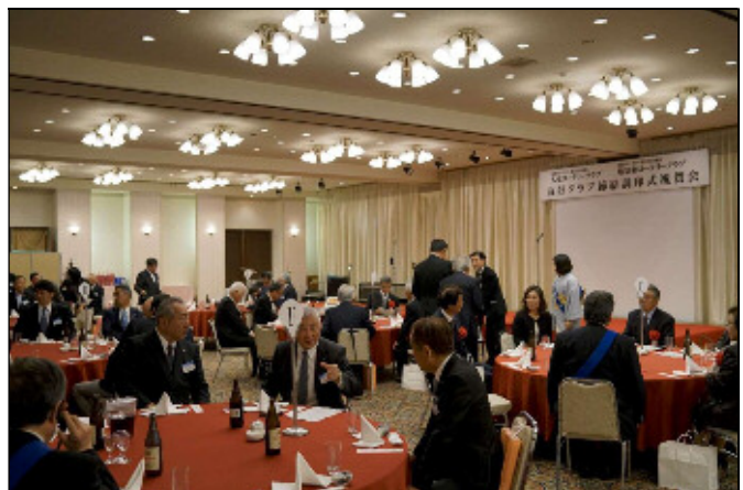
参加のみなさん、おつかれさまでした。