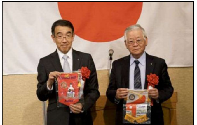
予備も含めて、持参したバナー全て交換。