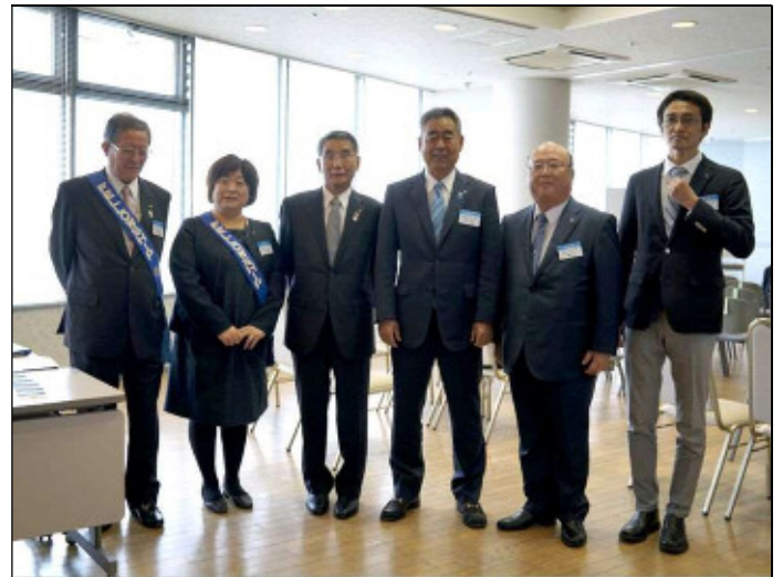
マリンゲート 会議室