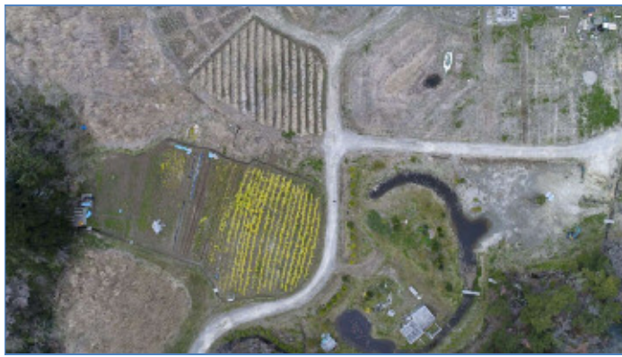
野々島の風景 2017.4.21 (金)