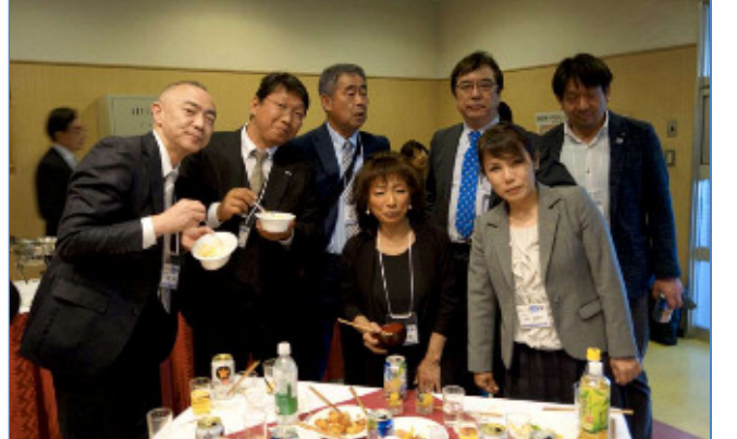
18:10 バスにて会場をあとに「おつかれさま」