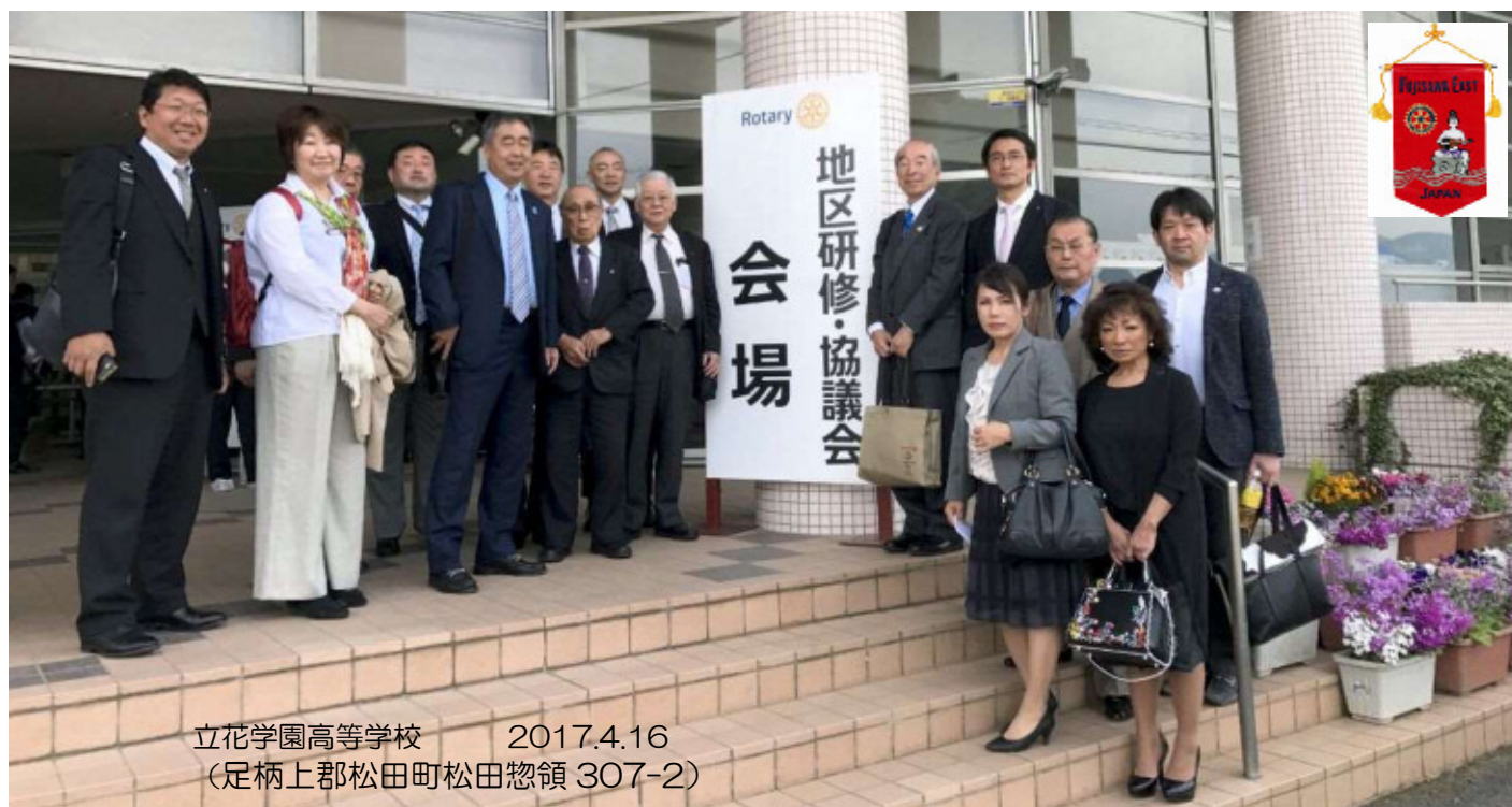
立花学園高等学校 2017.4.16 (足柄上郡松田町松田惣領 307-2)