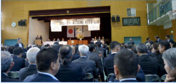
クラブで纏まって着席