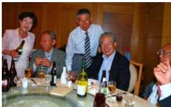
現次クラブ協議会 銀座アスター