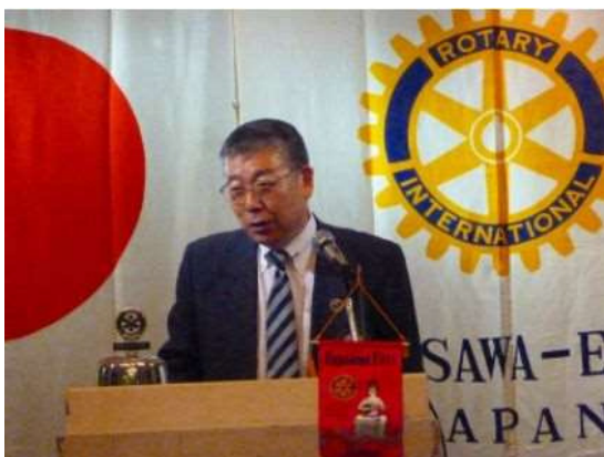
2013年5月28日 次年度クラブフォーラム