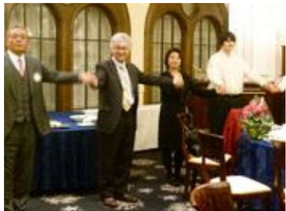
クリスマス家族例会