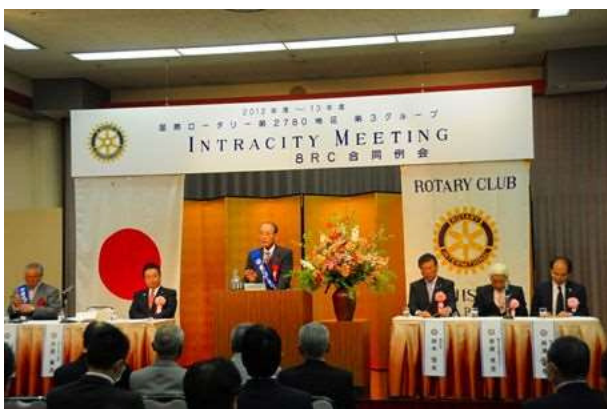
2013年3月9日 移動例会 IM ホストクラブ 藤沢 RC