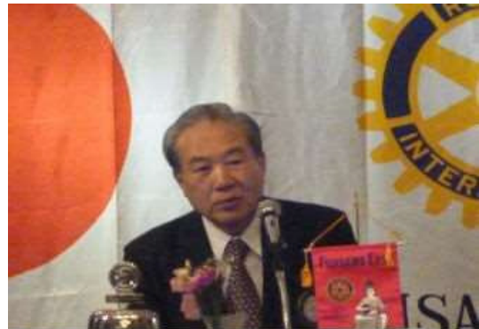
2012年3月31日 第3Gr 合同例会並びにIM ホストクラブ藤沢東 RC