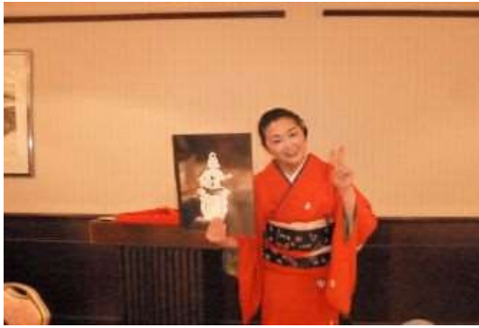
2012年1月17日 上半期クラブ協議会