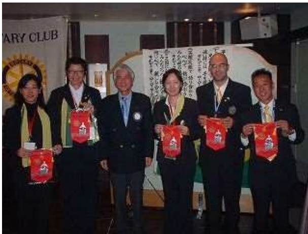
2007年3月20日 第4220地区GSEメンバー 歓迎夜間例会