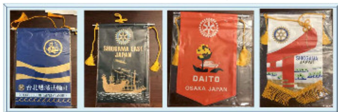
台北スワンシーRC、塩釜東 RC、大東 RC、塩釜 RC

塩釜東 RC、大東 RC、台北雙溪扶輪社、 塩釜 RC (4/22 土曜日塩釜東 RC にて)