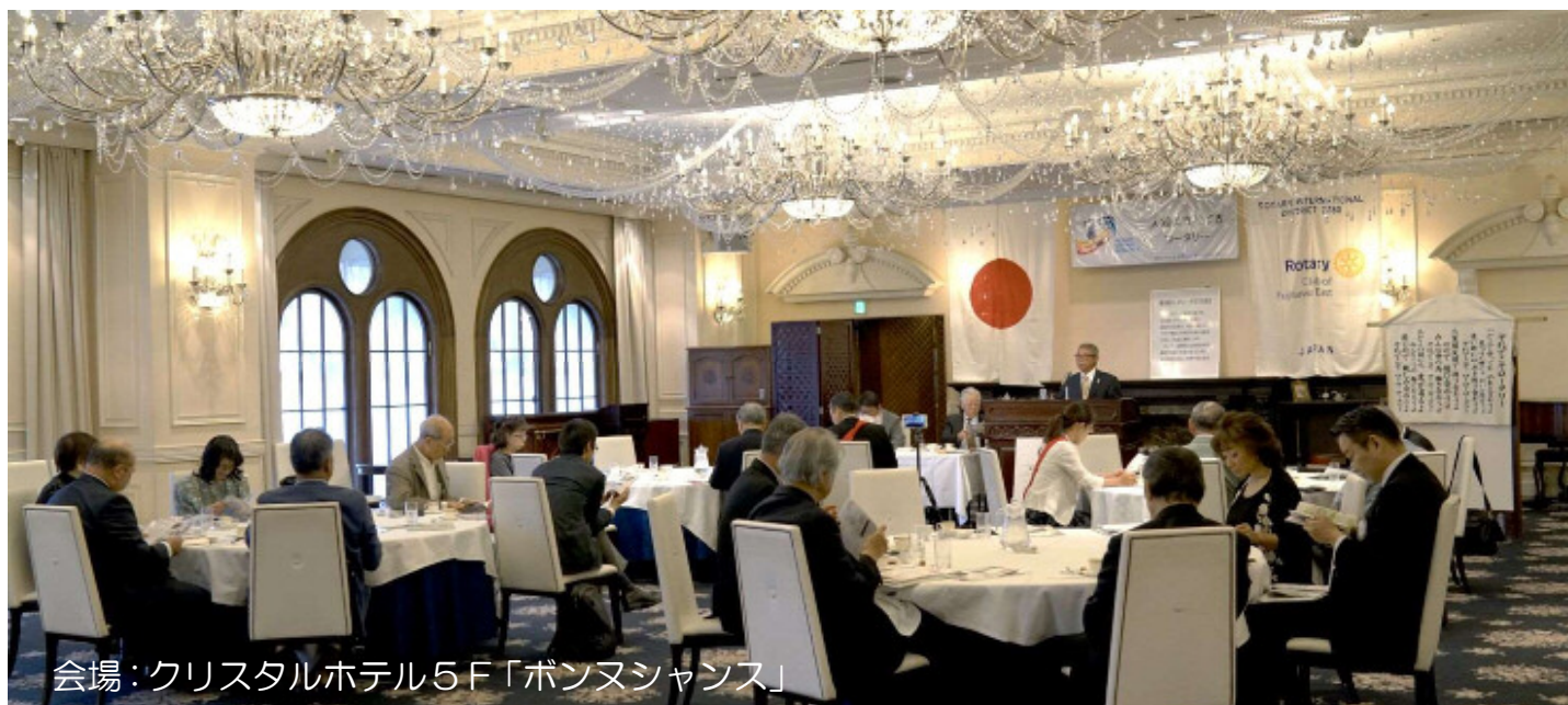
会場：クリスタルホテル5F「ボンヌチャンス」