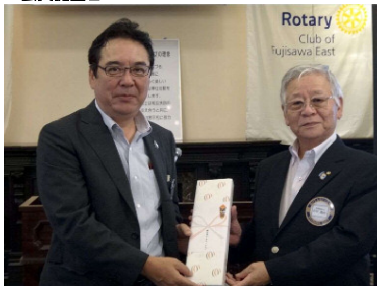
小柴会員と石田会長