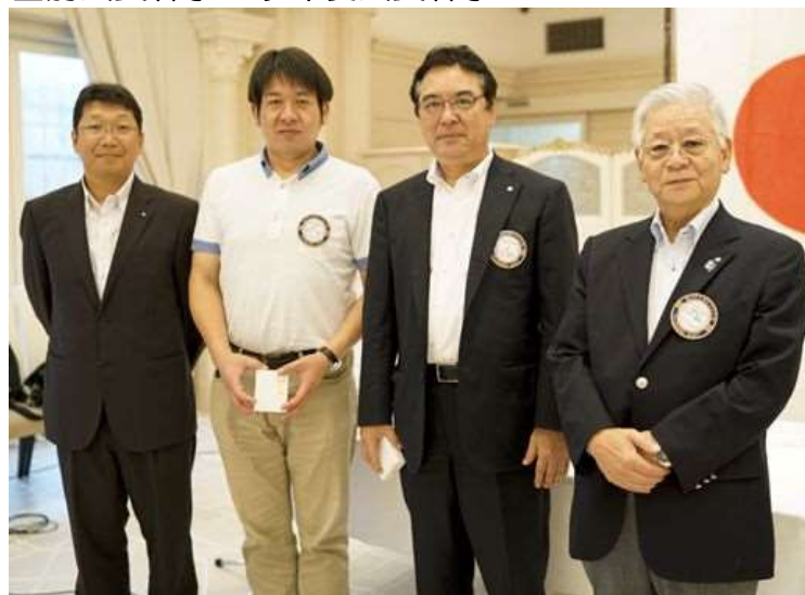
「1年間ありがとうございました。」 会長&幹事