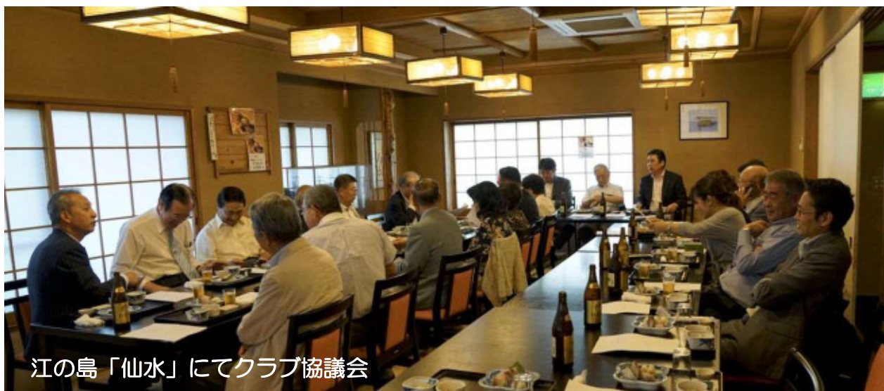
江の島「仙水」にてクラブ協議会