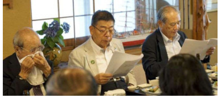
シャイニングボーイズの勧誘